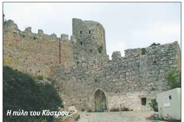
Η πύλη του Κάστρου

Σήμερα χρειάζονται όμως αναστηλώσεις και υποστυλώσεις για να διατηρηθεί το πολιτιστικό και ιστορικό αυτό μνημείο. Μικρές παρεμβάσεις γίνονται και σή-