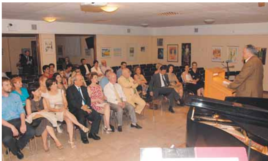
24 Ιουνίου «Κυπριακή Εστία». Εκδήλωση με την Κύπρια Επίτροπο της Ε.Ε.