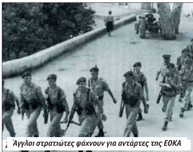
Άγγλοι στρατιώτες ψάχνουν για αντάρτες της ΕΟΚΑ

Δεν είναι για το σημερινό κατόντημά μας που κατέβηκε με τόση προθυμία στον τάφο η πολυπαθής γενεά του αντι-αποικιακού Απελευθερωτικού Αγώνα του 55-59, για ελευθερία και δικαιοσύνη έβαψαν πρόθυμα με το αίμα τους χώματα ιερά, της Αμμοχώστου και της Κερύνειας, της Πιτσιλιάς και της Πάφου και δια ελευθερία και δικαιοσύνη προσκαλούν όλους μας στην υπέρτατη