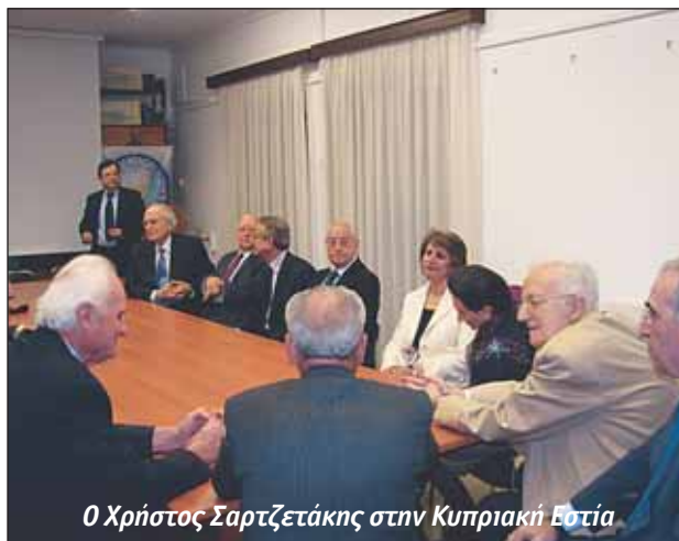
Ο Χρήστος Σαρτζετάκης στην Κυπριακή Εστία

Ο Απελευθερωτικός Αγώνας παρέμεινε η μόνη διέξοδος και μετά τετραετή σκληρή αναμέτρηση η ΕΟΚΑ κατέθεσε τα όπλα αποδεχόμενη την περί Ανεξαρτησίας της