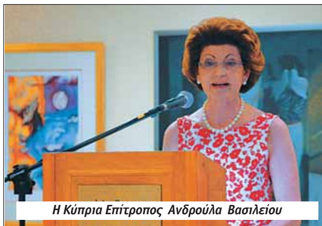
Η Κύπρια Επίτροπος Ανδρούλα Βασιλείου

Η Κύπρια Επίτροπος στην Ευρωπαϊκή Ένωση κ. Ανδρούλα Βασιλείου μίλησε σε εκδήλωση που πραγματοποιήσαν η Ο.Κ.Ο.Ε και το Σπίτι της Κύπρου στην Κυπριακή Εστία.