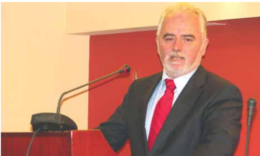
Ο υπουργός εργασίας κ. Γεώργιος Κουτρομάνης στο συνέδριο της Ο.Κ.Ο.Ε.