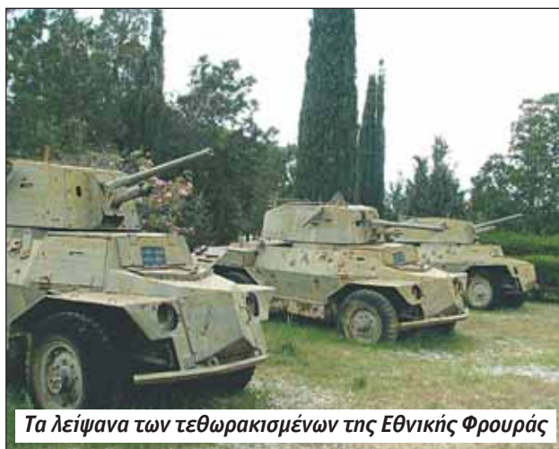
Τα λείψανα των τεθωρακισμένων της Εθνικής Φρουράς

Φεύγοντας ρίχνουμε ακόμη μια λοξή ματιά στο ύψωμα Πετρομούθια για να παρατηρήσουμε τη γιγάντια φιγούρα του ένοπλου στρατιώτη, δίπλα από τις μεγάλες σημαίες με την ημισέληνο του ψευδοκράτους και της Τουρκίας.