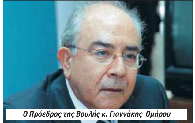
Ο Πρόεδρος της Βουλής κ. Γιαννάκης Ομήρου

Εμείς θα επιμένουμε στο αίτημά μας μέχρι να επιτύχουμε την αναγνώριση του δικαιώματος αυτού, τουλάχιστον για όσους μετανάστευσαν αναγκαστικά μετά το 1974. Έχουμε απόλυτο δίκαιο και δεν εννοούμε να υποστείουμε το λάβαρο του αγώνα για ισονομία και ισοπολιτεία .