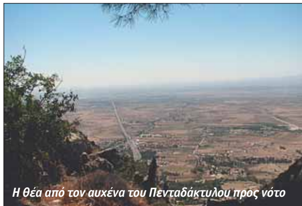
Η θέα από τον αυχένα του Πενταδάκτυλου προς νότο

Το ύψωμα "Κοτζά-Καγιά" παραμένει επιβλητικό, απόκρημνο και αχρησιμοποίητο, προς όφελος του φυσικού περιβάλλοντος. Τα λίγα εγκαταλειμμένα κτίσματα, μαρτυρούν την προγενέστερη στρατιωτική χρήση