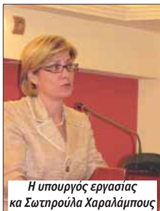
Η υπουργός εργασίας κα Σωτηρούλα Χαραλάμπους

Ο αναπληρωτής Πρόεδρος της Ο.Κ.Ο.Ε. παρέδωσε στον κ. Ομήρου γραπτό υπόμνημα της Ο.Κ.Ο.Ε. και ζήτησε συνάντηση της Ε.Γ. της Ο.Κ.Ο.Ε. με τους Προέδρους των Επιτροπών της Βουλής υπό την Προεδρεία του κ. Ομήρου, για δρομολόγηση διαδικασιών που θα οδηγήσουν σε νομοθετικές ρυθμίσεις για τη διασφάλι-