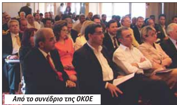
Από το συνέδριο της ΟΚΟΕ