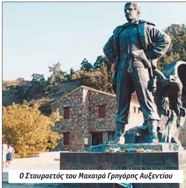
Ο Σταυραετός του Μαχαιρά Γρηγόρης Αυξεντίου

προσπάθεια για απαλλαγή από την ξένη κατοχή".