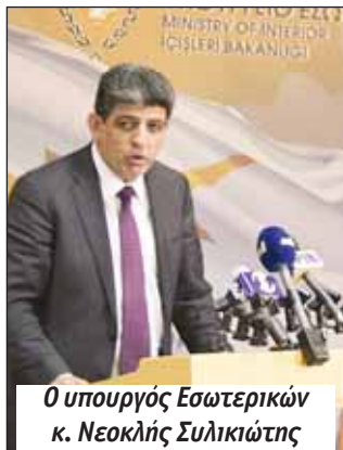
Ο υπουργός Εσωτερικών κ. Νεοκλής Συλικιώτης