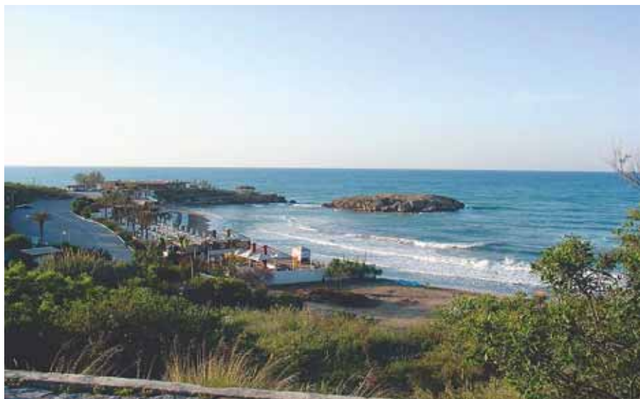
Πέντε Μίλι - η ακτή της απόβασης - η κερκόπορτα της Κύπρου