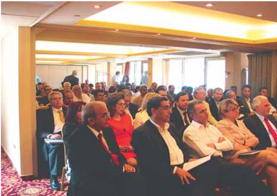
Από το συνέδριο της Ο.Κ.Ο.Ε.