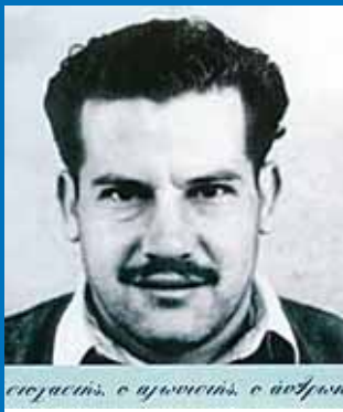
Ο ήρωας της ΕΟΚΑ Κυριάκος Μάτσις

υστέρησαν σε δόξα των Σπαρτιατών του Λεωνίδα, αλλά και υπερέβαλαν τούτους.