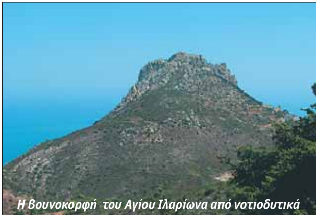
Η Βουνοκορφή του Αγίου Ιλαρίωνα από νοτιοδυτικά

ήταν μάταιη, για αυτό η 33ΜΚ υποχώρησε αφήνοντας στα υψώματα δώδεκα νεκρούς, τον Διοικητή της, έναν έφεδρο αξιωματικό και δέκα οπλίτες..